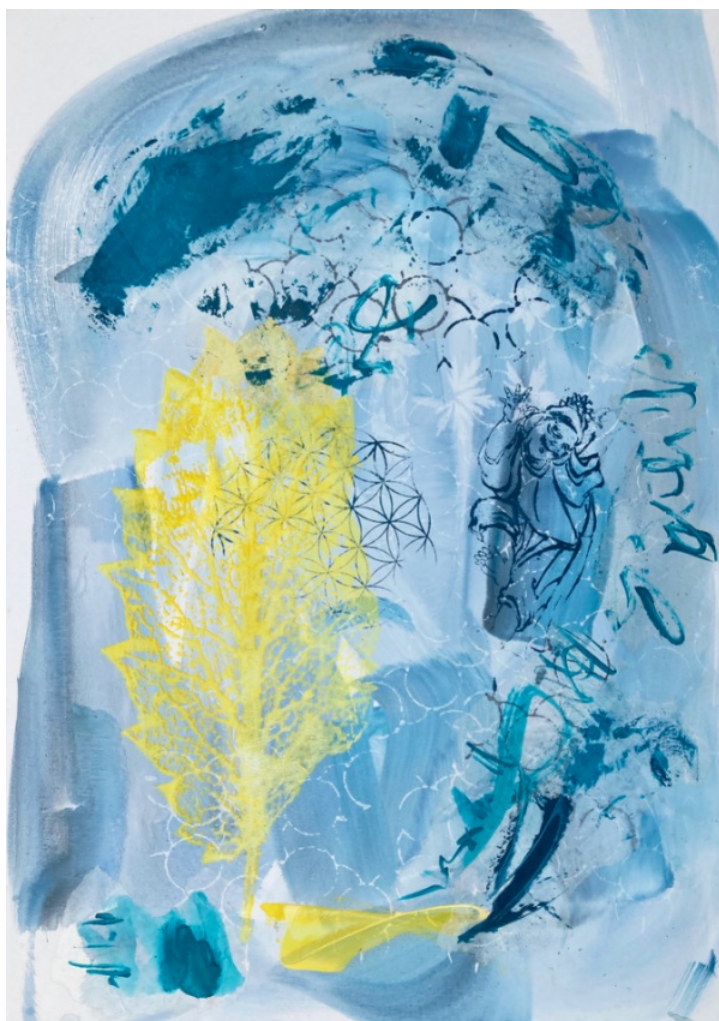
Ma peinture DANCE COSMIQUE 65x92cm

m'a toujours fasciné et est essentielle si nous voulons devenir les créateurs de notre vie et trouver de nouvelles idées créatives dans notre travail. Nous pouvons apprendre à collaborer avec le champ quantique!